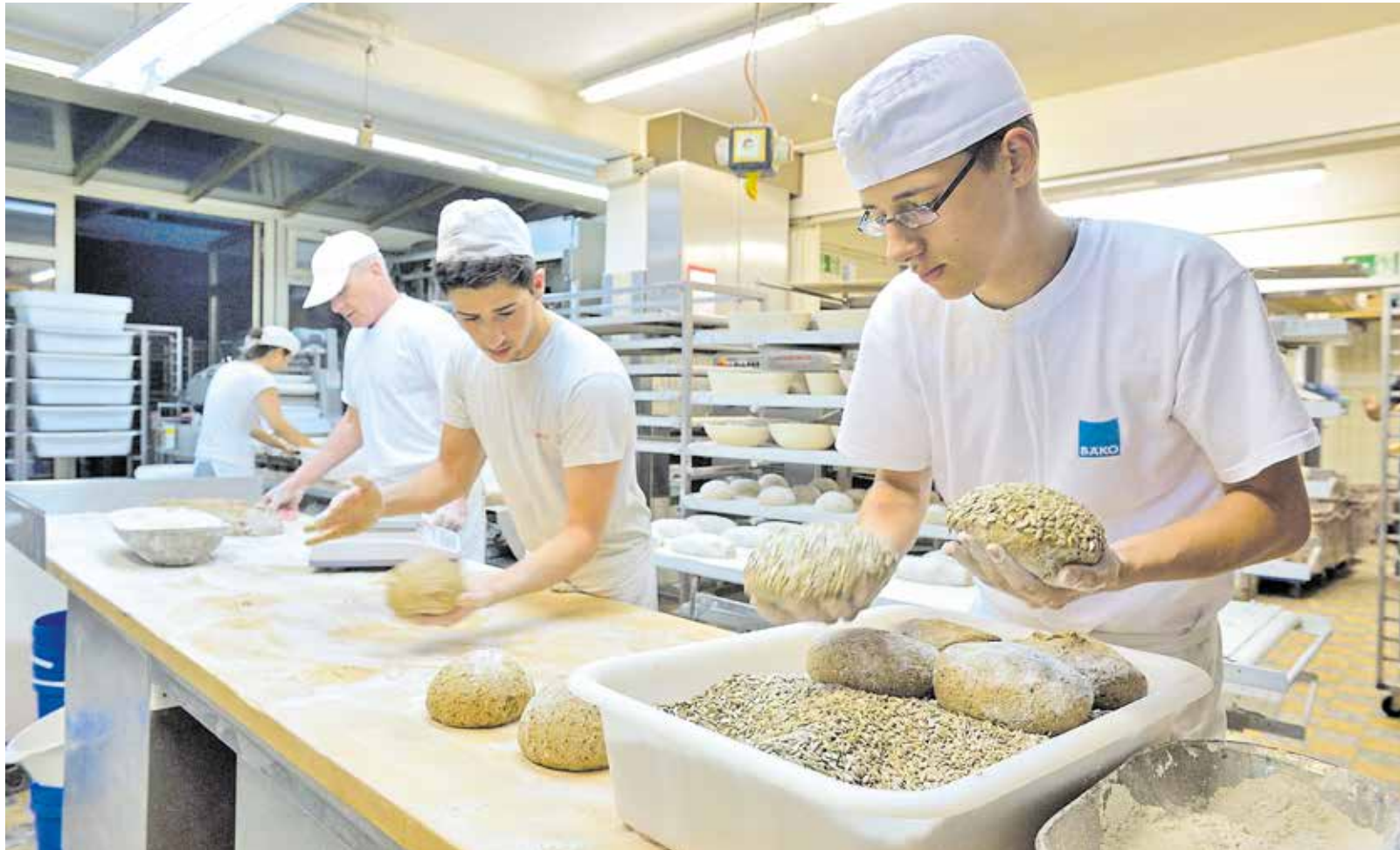
Auch die Bäcker merken die stark steigenden Energiepreise.