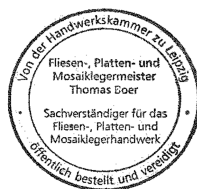
Originalgröße: Durchmesser 43 mm