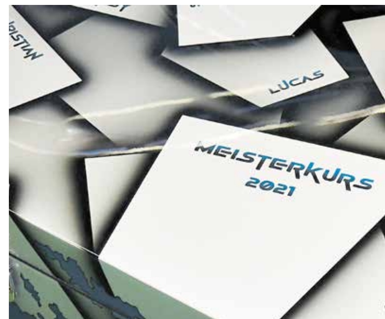
Wie erinnert sich ein Maler- und Lackierermeister an seinen Meisterkurs?

Natürlich mit einem selbst gestalteten Werkstück!