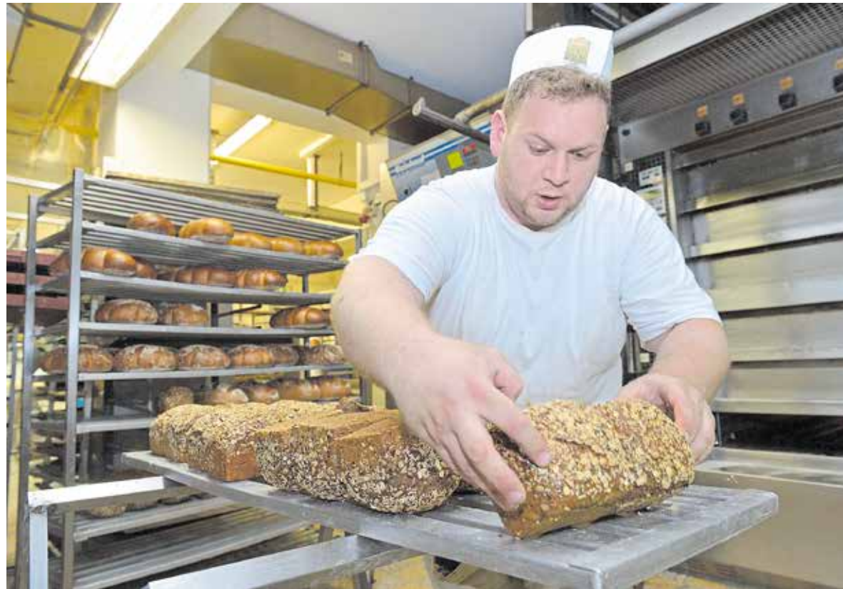
Wann kommt der Aufschwung? Das Nahrungsmittelhandwerk in Südthüringen hofft auf bessere Geschäfte in naher Zukunft.

Dementsprechend bewegt sich die Auslastung etwa auf Vorjahresniveau. 42 Prozent (Vorjahr 40 Prozent)