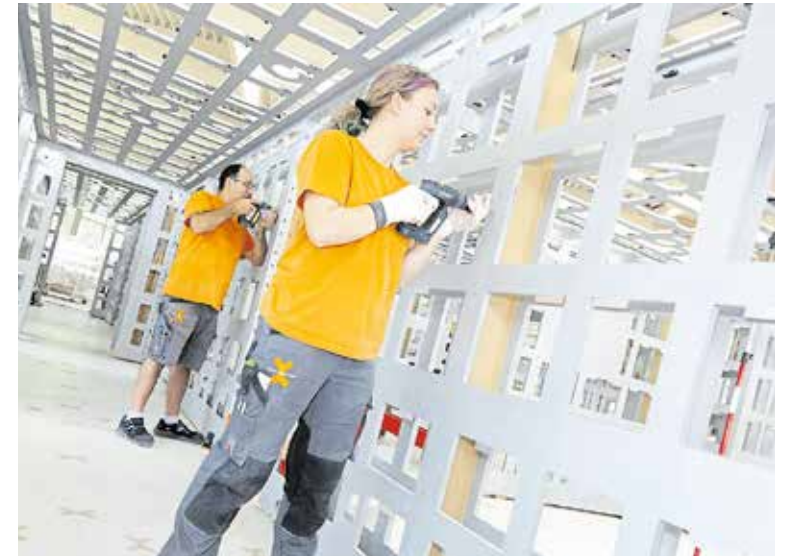
Vielfalt, Verantwortung und Anerkennung – das suchen Südthüringer Azubis vor allem in ihrem neuen Handwerksberuf. Laut Umfrage der HWK Südthüringen ist die Ausbildung zum Tischler in Sachen Abwechslung ganz vorne mit dabei.