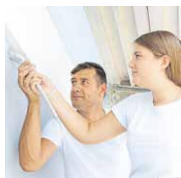
Die Praktikumsprämie ist ideal für Schülerinnen und Schüler, die das Thüringer Handwerk kennenlernen möchten.

Der Freistaat Thüringen hatte 2024 die Praktikumsprämie für Schülerinnen und Schüler erstmals eingeführt