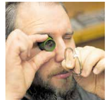
Die Ausbildung für Gold- und Silberschmiede wurde neu geregelt.