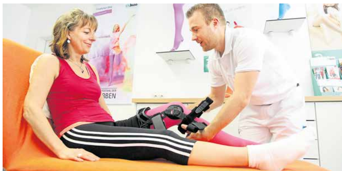
Kundennahe Handwerke haben in der aktuellen Wirtschaftslage Vorteile.

Entsprechend niedrig ist auch weiterhin der Auslastungsgrad. 44 Pro-